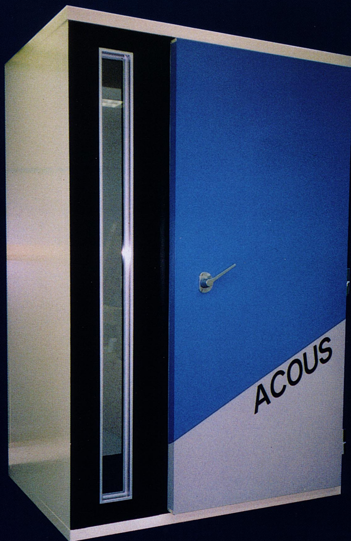
写真はオプション仕様